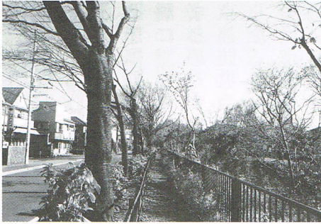
名勝小金井桜の整備が進む小金井公園正門付近

玉川上水沿道と名勝小金井桜の整備が予定どおり進んでいます。新小金井橋から関野橋までのモデル区間では、樹木の伐採や剪定により日当たりが良くなり、桜だけでなく野花（ニリンソウ、ノカンゾウ、ヒガンバナ等）の復活も期待できるとのこと。今後の景観が楽しみです。